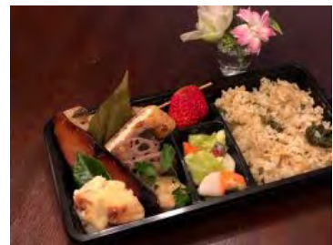
(千年変わらぬ風景と食文化の融合ワークショップ)